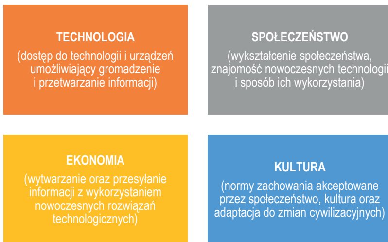
Rys. 2. Czynniki społeczeństwa informacyjnego

Z pewnością pojęcie społeczeństwa informacyjnego jest zjawiskiem znanym większości ludziom. Uważa się, iż jest to znak rozpoznawczy współczesności świadczący o wartości informacji. Ta pogłębiająca się tendencja ściśle powiązana jest z postępem technologicznym, w wyniku którego informacja nie tylko coraz mocniej przenika do życia człowieka, lecz także skłania do jej ciągłego poszukiwania. W tym kontekście należy podkreślić rosnącą potrzebę zdalnego komunikowania się, co jest możliwe ze względu na dotychczasowe osiągnięcia technologiczne. Biorąc pod uwagę powyższą tendencję, obecne pokolenia są świadkiem regularnego procesu rozwoju zdolności szybkiego przesyłania informacji pomiędzy odbiorcami, co w aspekcie bezpieczeństwa danych oraz użytkowników staje się zarówno zaletą, jak i zagrożeniem. Społeczeństwo informacyjne, mimo że jest to pojęcie stosunkowo młode, doczekało się już swojej definicji. Zagadnienie to określane jest jako pewna rzeczywistość zależna od czterech elementów. Są to czynniki kulturowe, społeczne, technologiczne oraz ekonomiczne. Wszystkie one odpowiadają za określone zmiany w obrębie społeczeństwa, dzięki czemu wspólnie tworzą kompleksowy jego obraz w wymiarze informacyjnym. Do wspomnianych czynników należy zaliczyć (Łuszczuk, Pawłowska, 2000, s. 86-88): technologię, społeczeństwo, ekonomię i kulturę (zob. rys. 2).